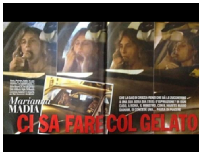
Figura 2. La prima pagina dell'articolo di "Chi" sul Ministro Madia.

Esempio eclatante di una stampa priva di contenuti e propensa a scivolare nel volgare per tentare di accaparrare qualche lettore spinto da curiosità e interesse per l'osceno, questo articolo fa temere che la tendenza a tale bassezza si diffonda come reazione all'impossibilità di poter gestire le notizie più importanti che riguardano i personaggi politici.