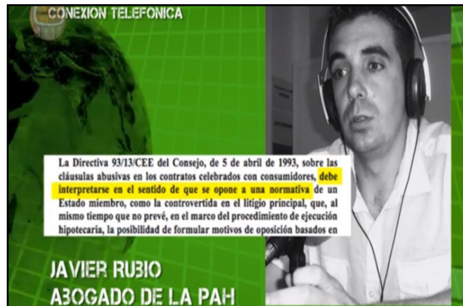
Imagen 1. Inserción de recuadros con información contextual

A nivel de edición, se incorporan recuadros que incluyen fragmentos de normativas como se puede observar en la siguiente imagen (capítulo piloto) y la inserción de información complementaria (que utilizan en el capítulo 3). Otro ejemplo de contextualización es la incorporación de un spot que informa sobre las metas de la PAH.