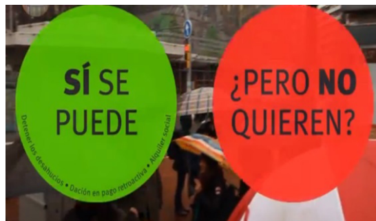
Imagen 2. Logo Sí Se Puede ¿Pero No Quieren?

En varios momentos de los capítulos se insertan los logos donde puede leerse: "Sí se puede", o "Sí se puede, ¿pero no quieren?" Estos logos aparecen en espacios intermedios entre las noticias y también como imágenes de archivo durante las entrevistas. También se recurre a imágenes en las que aparecen pegatinas situadas en distintos puntos de las ciudades o pancartas de diferentes manifestaciones en las que se repite la frase "Sí se puede". A esto se añade la selección de fragmento que retratan a los activistas gritando estos lemas. En la presentación del capítulo 2 se inserta una imagen de una flor que crece en un clima desértico, con lo cual se retrata este marco de esperanza.